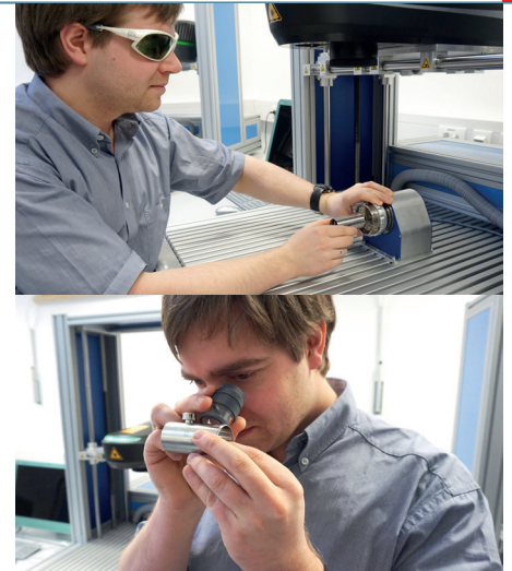
Musterbeschriftung und -prüfung im hauseigenen Applikationslabor

Neben der ständigen Weiterentwicklung der Produkte hebt sich die ACI Laser GmbH vor allem durch seine individuelle Anwenderbetreuung vom Markt ab. Denn egal, ob Hard- oder Software – entwickelt und bedient werden die Lasersysteme von Menschen – und diese stehen bei der ACI Laser GmbH im Vordergrund. So wird bei der Auswahl der für den Kunden passenden Technologie grundsätzlich im engen Kontakt mit den Mitarbeitern des technischen Vertriebs die beste Lösung gefunden. Besonderer Wert wird dabei