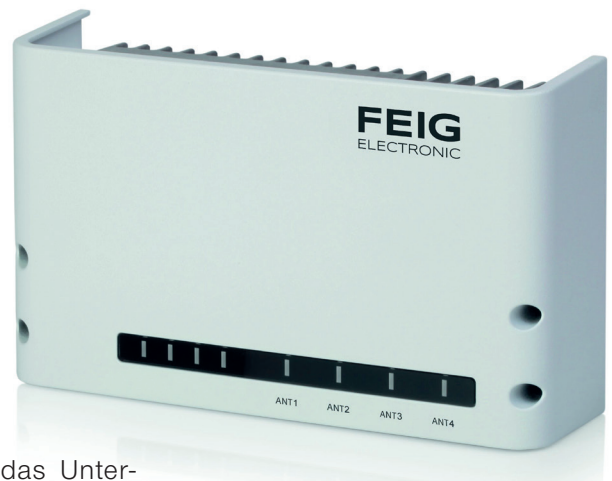
Die neueste Version des UHF Long Range Readers LRU1002 mit Secure Element und zahlreichen weiteren Features.

Seit 2015 existiert mit PAYMENT ein vierter Produktbereich bei FEIG ELECTRONIC. Hier werden Payment Terminals für offene und geschlossene Bezahlsysteme entwickelt und produziert. Den Schwerpunkt bilden Terminals für Ticketing-Lösungen im Öffentlichen Personenverkehr, die in Validatoren oder Zugangssperren eingebaut